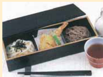
2-noodle combination tempura meal 合盛天ぷら御膳 拼盘天妇罗御膳套餐