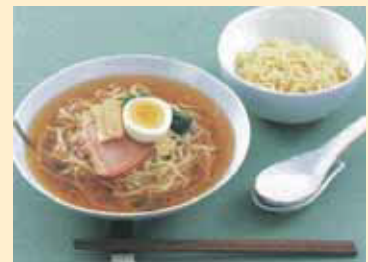
Ramen noodles (large serve) 大盛ラーメン 大份拉面