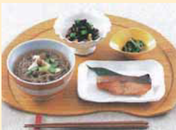
Balanced, healthy meals ヘルシーバランス定食 健康营养平衡定食套餐

适合老人和儿童的小份商品、御膳套餐或定食套餐的副菜菜品、大份商品或追加面用的面品等,针对客户多方面的购买内容和需求高效率地提供服务。